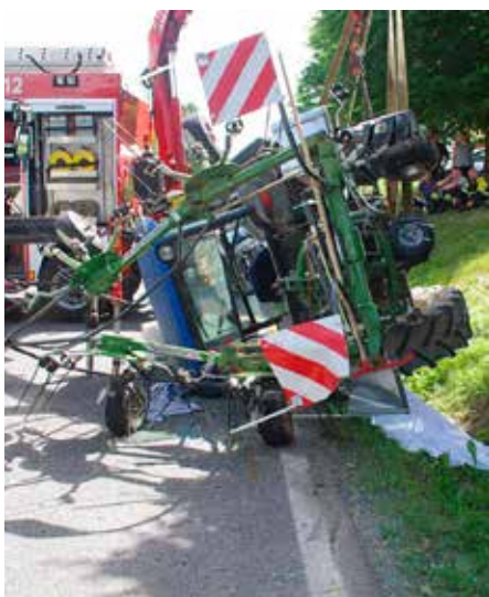
Prometna nesreča 22. junija 2021 na cesti Postojna–Hruševje. Nalet osebnega avtomobila, prevrnitev traktorja in padec voznika, ki ni uporabljal varnostnega pasu, iz kabine pod traktor, kjer je je umrl.

Pri uporabi traktorjev in drugih kmetijskih strojev se nezgode dogajajo tako v cestnem prometu, ki jih Policija obravnava kot prometne nesreče, kot pri delu izven cest, ki jih Policija obravnava kot delovne nezgode. Delovnih nezgod s traktorji in kmetijskimi